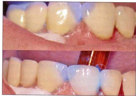
Fig. 3 Comparación de la translucidez de un puente Lava (abajo) y del puente contralateral en metal-porcelana (arriba).

En los sistemas de zirconio influye mucho el tipo reprocesado en las cualidades ópticas y mecánicas. En este sentido los autores del presente artículo han encontrado una translucidez clínica mayor en de lo que cabía esperar en el sistema Lava (fig. 3).