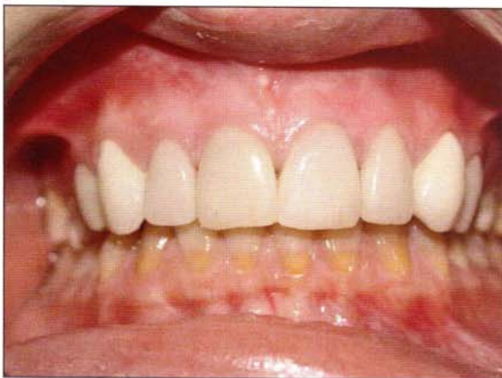
Fig. 1 Caso resuelto con dos tipos de materiales diferentes. Los cuatro incisivos con carillas feldespáticas y los caninos con coronas Procera. Obsérvese la diferencia de translucidez que presentan los materiales.

El ajuste de las cerámicas es esencial para que las restauraciones tengan una resistencia adecuada y para evitar la filtración de caries, logrando así una mayor supervivencia clínica en el medio oral a largo plazo. El ajuste depende de tres factores fundamentales: contracción de sinterización, técnica de elaboración en el laboratorio y tipo de preparaciones. Hoy se toma, como clínicamente aceptables los ajustes menores de 120 micras 2 .