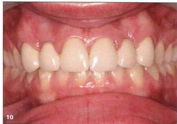
Figs. 9 y 10 Resolución de un caso de agenesia de incisivos laterales con sustrato favorable con puentes de porcelana Lava.