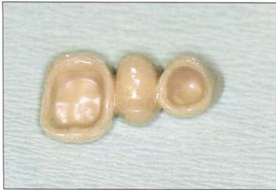
Fig. 13 Puente posterior de tres piezas para reponer un primer premolar en zirconio Lava.