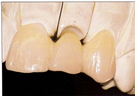
Fig. 2 Puente del sector anterior realizado en Empress 2, con gran translucidez pero que requiere conectores de grandes dimensiones.

La elección del material depende de los requisitos mecánicos previstos para el puente. De esta manera, si se trata de la reposición de un único diente en el sector anterior (salvo el canino) sin que haya una curva excesiva o una clase II-2. a (gran sobremordida y escaso resalte) y disponemos del espacio protético adecuado, se puede usar el material cerámico que mejor convenga, dando cierta preferencia a la estética sobre la resistencia mecánica (el puente será translúcido y adecuado ópticamente para la estética, pero será menos resistente que las demás y por ello puede ser necesario realizar unos conectores de gran dimensión sentido ocluso-gingival, con lo que el puente puede quedar con una morfología menos natural). Por otro lado, si se usa un material más resistente (p. ej., puente policristalino de zirconio) se pueden reducir las dimensiones de los conectores