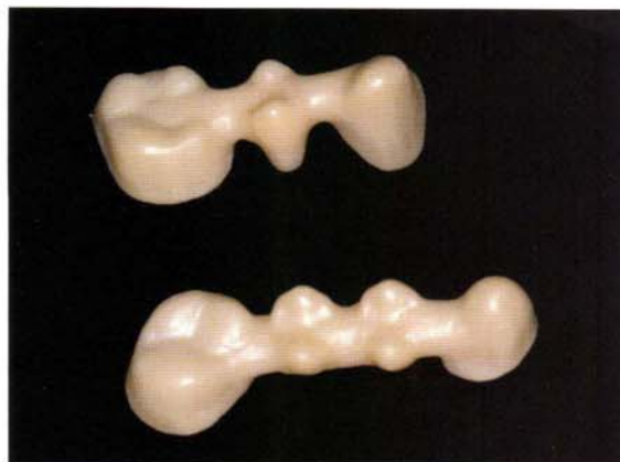
Fig. 14 Estructuras de Lava para confección de puentes.

Lo que sí que parece claro es que el mejor ajuste se logra con la técnica de inyección bajo presión, obteniéndose resultados mejores aún que con la técnica de metal-porcelana, lo cual puede ser debido a las pequeñas desadapta-