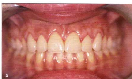
Figs. 4 y 5 Restauración de dientes anterosuperiores con buen sustrato y oclusión favorable mediante coronas Empress 2.

También las coronas Procera han obtenido resultados favorables a 10 años y funcionan de forma parecida a las coronas de metal-porcelana 10 , con unas tasas de éxito a los 5 años del 97% y a los 10 años del 93% 55 . Diversos estudios avalan también al sistema Empress y se encuentran tasas de éxito del 98,9% a los 6 años de media en coronas del sector anterior, si bien esa tasa disminuye en el sector posterior (84%) 57,58 .