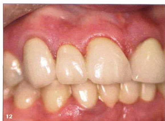
Figs. 11 y 12 Caso en el que uno de los dientes presenta un muñón colado que debe enmascararse (sustrato desfavorable). Puente de zirconio Lava.