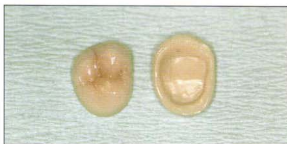
Fig. 8 Restauraciones unitarias realizadas en zirconio Lava.

Los puentes dentales confeccionados mediante porcelanas de alta resistencia tienen su principal indicación en el sector anterior, donde la estética juega un papel fundamental. Todos los materiales cerámicos modernos de alta