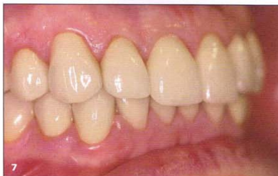
Figs. 6 y 7 Restauración de ambas arcadas en un caso de tinción severa por tetraciclinas y con oclusión favorable. Incisivos inferiores con carillas opacificadas, el resto con coronas Lava.